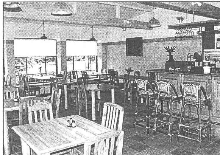
● Kafejnīcas interjers veidots 30.-40. gadu stilā