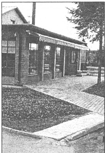
● Riekstiņš pie Rubusa