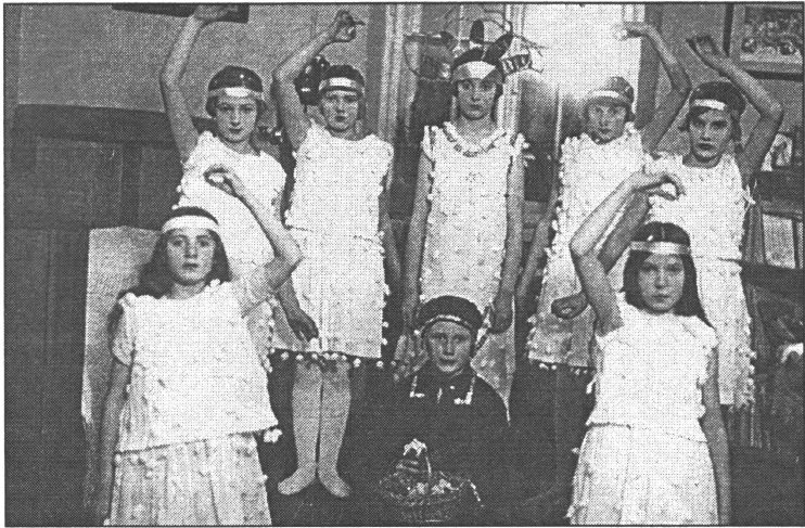
● Ziemsvētku sarīkojums Doles skolā 1932.g.

Doles pagasts bija viens no tiem Latvijas pagastiem, kuri 1. pasaules karā cieta vissmagāk. Vairāk nekā 90% no visām saimniecībām bija karā galīgi nopostītas. 1. pasaules karš Doles apkārtni pārvērta frontes zonā. 1916. g. nopostītas visas trīs Doles pagasta skolas, tai skaitā arī Doles salas Zandera skola.