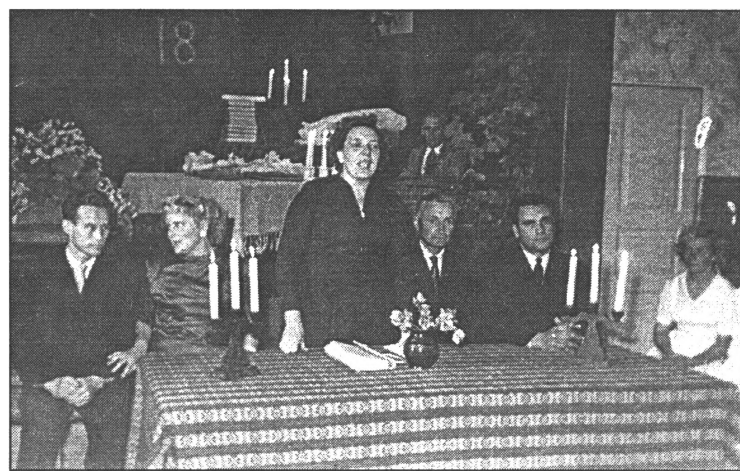
● Pilngadības svētki 60.g. sākumā

Padomju laikā mēs visi mācījām domāt tā, lai "vilks paēdis un kaza dzīva". Tāpēc iecerējām veidot Daugavas muzeju. Lai blakus hidroelektrostacijai vēsturei rādītu arī Daugavas ūdens ceļa vēsturi, rādītu Daugavas laivenieku,