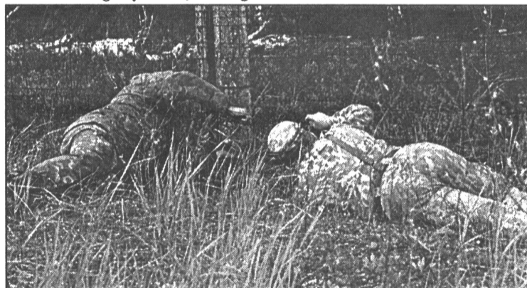
● Viens no uzdevumiem - dažādu šķēršļu pārvarēšana. Šoreiz - dzeloņstieplu žoga