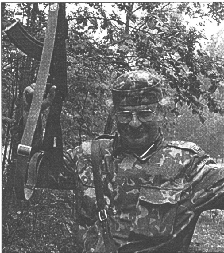
● Par Salaspils zemessargu mācībām lasiet 2. lpp.!