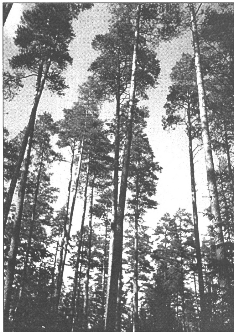
● Smiltenes izcilā priežu audze