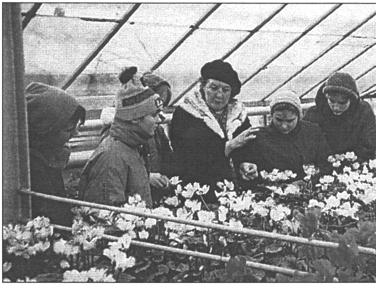
● Lai labāk iepazītos ar Nacionālo botānisko dārzu, skolēniem ir iespēja darboties Jauno dārznieku skolā

*krievu val. - Mēs vienkārši pastaigājāmies