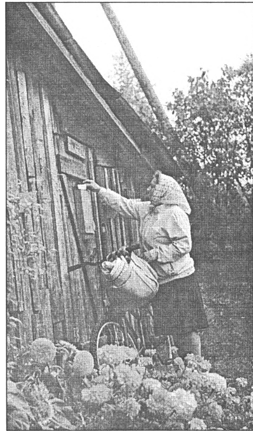
● Doles pastniece Zina Strože ikdienas darbā gaitās mēro 30 līdz 35 kilometrus