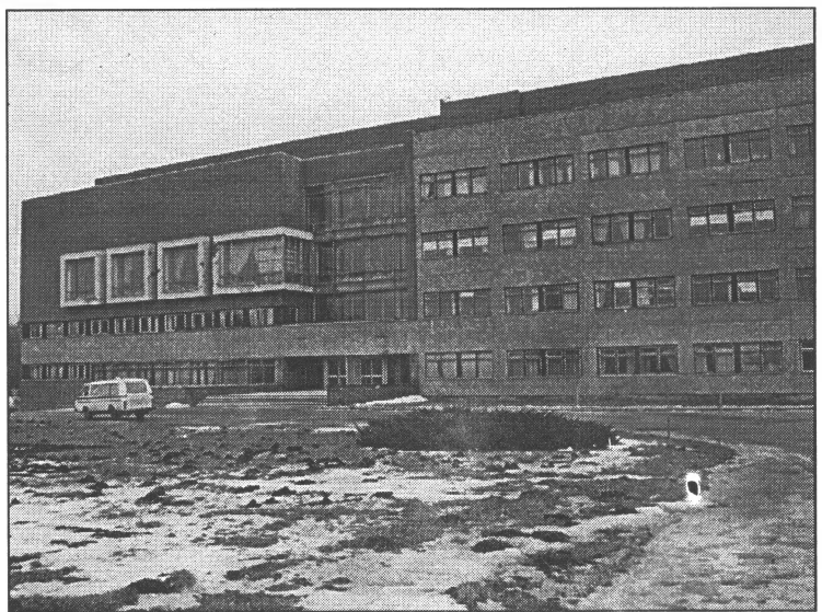
● RTU Neorganiskās ķīmijas institūts

Veicam valsts finansētos t.s. tirgus orientētos pētījumus, izpildot vidēji divus procentus gadā. Piedalāmies trīs valstiski nozīmīgās programmās, kas saistītas