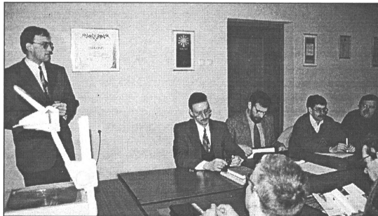
● Seminārs domē par siltumregulāciju

19. janvārī pilsētas domē notika seminārs Siltumapgādes iekārtu regulatori - piedāvājums un praktiskais izmantojums . Semināru vadīja firmu Baltijas-Vācijas tirdzniecības nama un Lekifa pārstāvji. Piedalījās domes, pašvaldības uzņēmumu vadītāji un dzīvojamā fonda apsaimniekotāji. Semināra praktiskā daļa notiks 26. janvārī Ozolniekos.