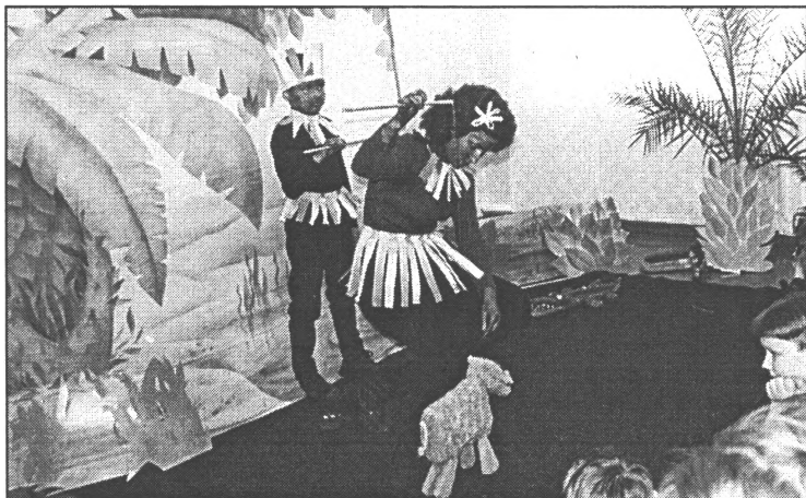
● Latvijas kristīgo misiju Svētdienas skolas audzēkņi izrādīja teatralizētu uzvedumu "iz džungļu dzīves"

(Turpinājums. Sākums 1. lpp.) niem dažādas nodarbības un pulciņus, kurus vadīs gan bērnu mamas, gan viņa pati. Protams, bērni šeit netiks atstāti bez uzraudzības. Ar vecākiem ir norunāts, ka kāda no mammām visu laiku atradīsies viņiem līdzās.