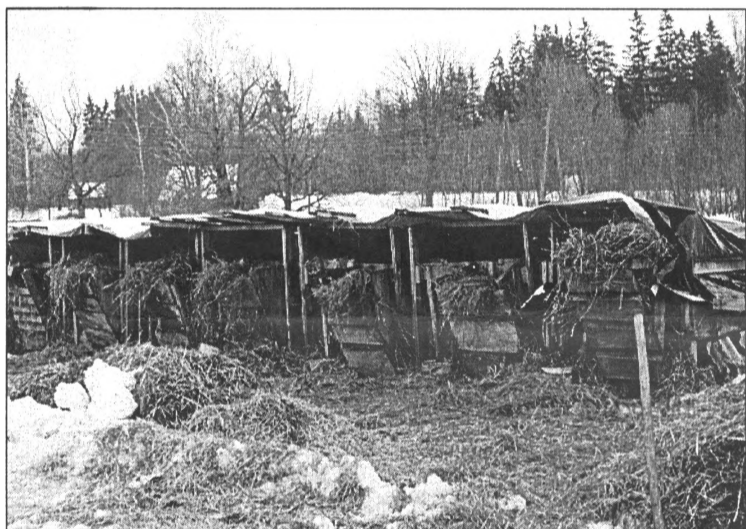
● Tā - ārā, sniegā, vējā, salā, nevis siltā kūti - tiek turēti jaundzimuši teliņi

Valmieras reģionā redzētajās saimniecībās lopi turēti tā saucamajās vieglā tipa kūtīs, kur vējš un aukstums, turklāt lopi ir nepiesietti.