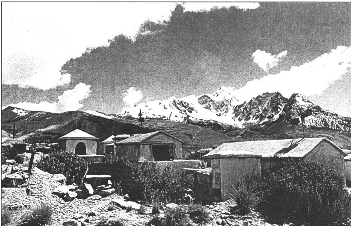
● Indiāņu kapsēta Bolīvijā, pie galvaspilsētas Lapasas, kura ir "visaugstākā" galvaspilsēta pasaulē - tā atrodas gandrīz 4000 metrus virs jūras līmeņa

Ja tava sieva un viņas advokāts sliktu, un tev vajadzētu izvēlēties, ko tu darītu: ietu vakariņot vai uz kino?