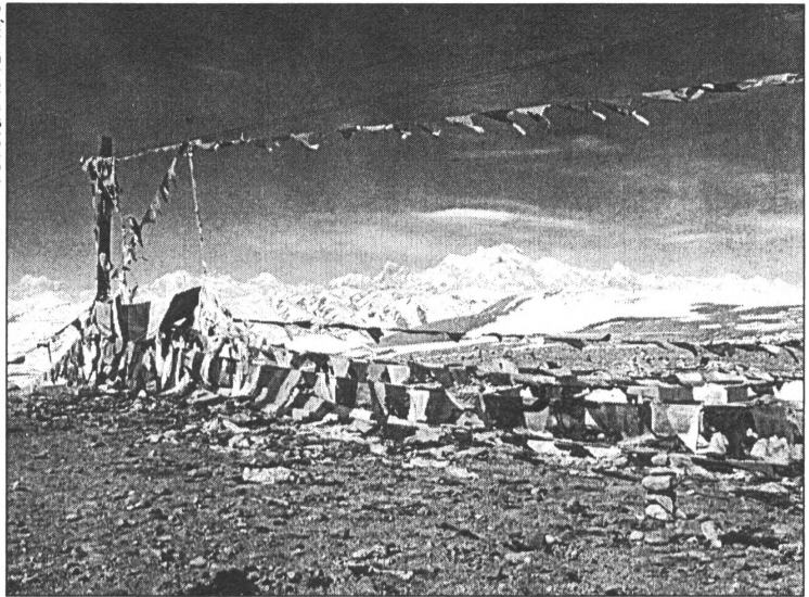
● Budistu lūgšanu karodziņi uz 5050 m augstas pārejas Tibetā. Fonā mazākais astoņtūkstošnieks Šiša Pangma (8013 m)

- Vai ir mainījusies tava sākotnējā kalnu uztvere un tagadējā?