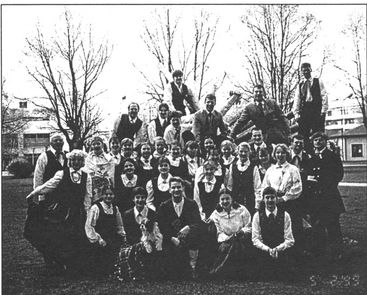
● Tiāde un Diks pēc spožās uzstāšanās