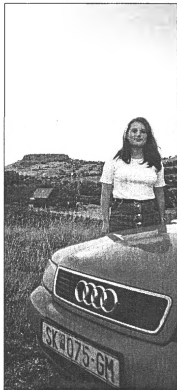
● Pie Maķedonijas jaunākā vulkāna