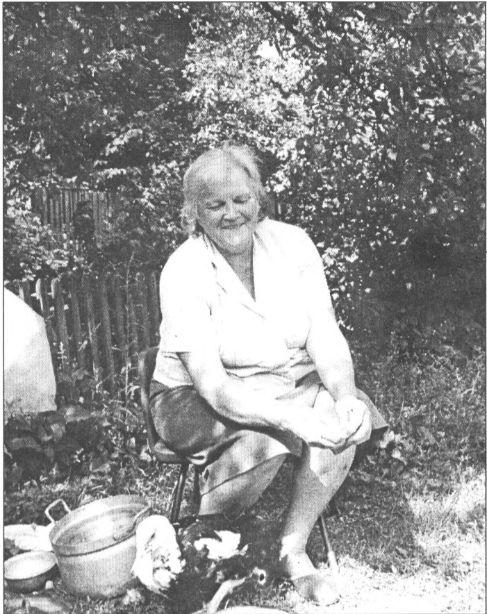
● Skaistlauku saimniece