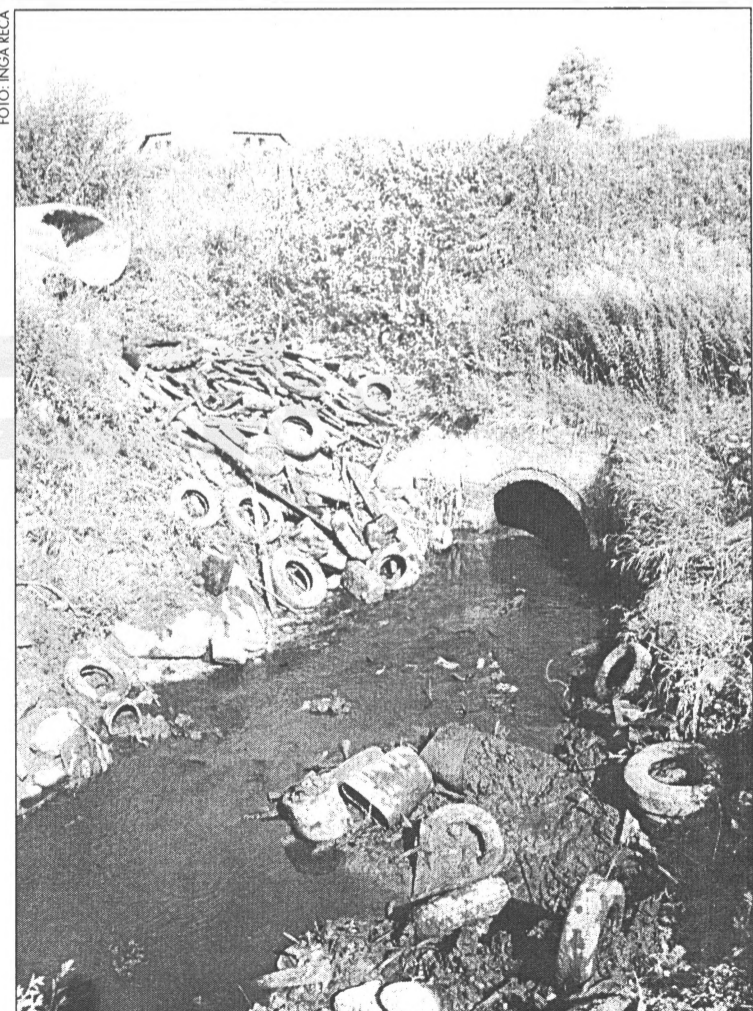
● Kultūras slāni, kurā ietilpa riepas, deļi u.c. atkritumi, jūnija un jūlija laikā no meloriācijas caurtekām atraka P/U Valgums viri. Cerams, ka, pirms tiks izstrādāts un ieviests jauns pilsētas meloriācijas sistēmas projekts, arī pēc šīs tīrīšanas ikpavasara plūdi Salaspili samazināsies.