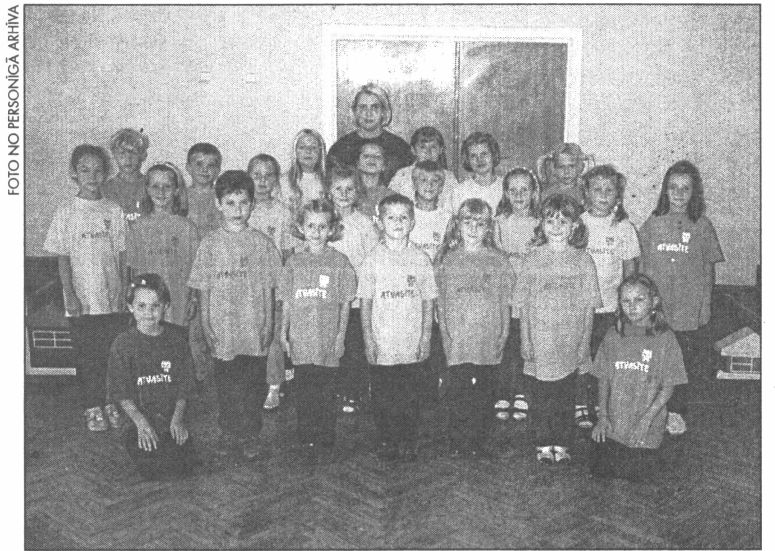
● Popgrupa Atvasīte šobrīd ļoti aktīvi gatavojas Ziemassvētku koncertiem