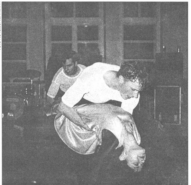
● Uzstāšanās reizē Jaunmoku pili

var pavilkt. Es būtu ļoti priecīga, ja man nevajadzētu nodarboties ar finansiālām lietām. Varbūt ar laiku mums būs menedžeris, kas ar to nodarbosies. Organizējot šo dzimšanas dienas koncertu, katrs dejotājs kaut ko darīja - viens organizēja, lai būtu laba afiša, cits meklēja kokus jaunam skatuves ietērpam, katram bija kāds darbs, kaut visi ir ļoti aizņemti cilvēki. Laikam dzīvē tā ir - jo mazāk laika, jo vairāk var izdarīt.