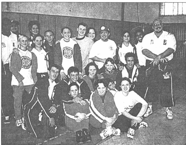
● Pasaules junioru čempionātā 2000. gada 6. - 7. aprīlī Čehijā. Brazīlijas, Čehijas un Latvijas sportisti