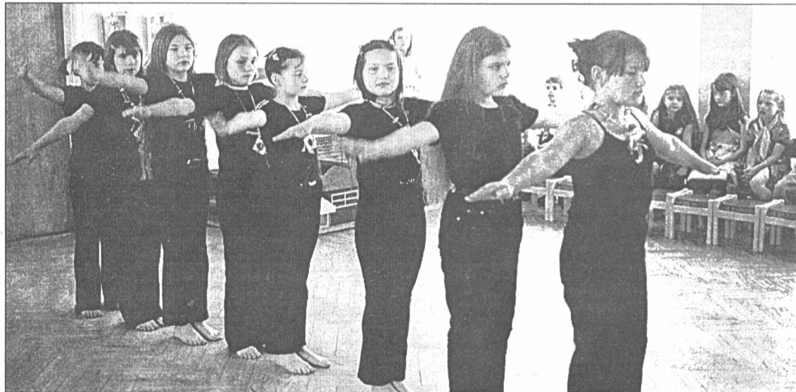
● Mākslas dienu-2000 ietvaros notika arī dažādi lokāli pasākumi. Piemēram, Salaspils sākumskolā risinājās Nepieradinātās modes diena