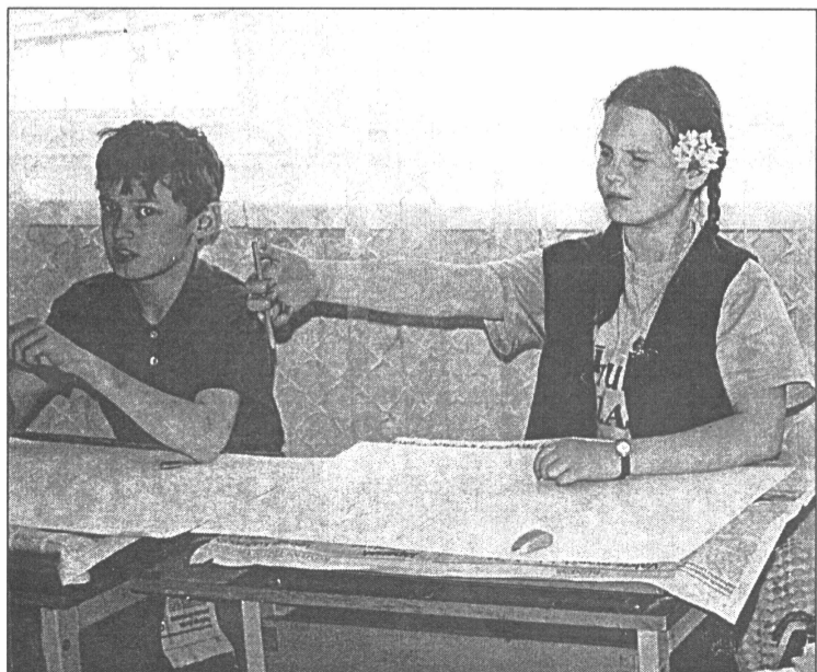
● Savukārt Mākslu skolā notika atvērto durvju dienas, kuru laikā ikviens interesents varēja vērot kā šajā skolā notiek bērnu apmācība