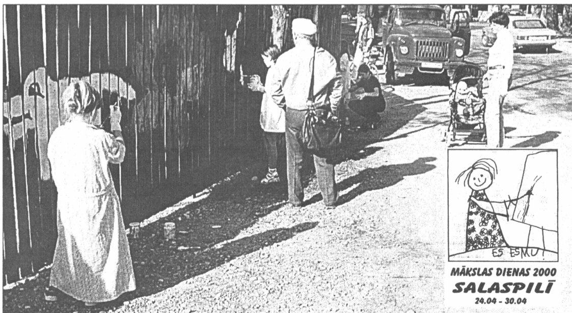
● Neapšaubāmi pats publiskākais Mākslas dienu - 2000 nedēļas pirmās puses notikums bija sētas Rīgas ielā 35 apgleznošana. Garāmgājēji gan priecājās par bērnu veikumu, gan deva dažādāzādus padomus kā labāk