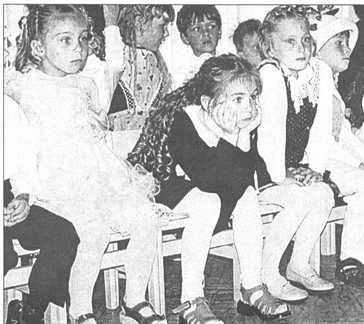
● Interesanti, ko tik tie "kolēģi" neizdomā!

No 24. līdz 30. aprīlim Salaspilī risinās Mākslas dienas ar devīzi "Es esmu!"