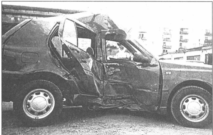
● “Šobrīd īpaši specializējamies automašīnu restaurācijā pēc avārijām”

vakaros un brīvdienās savā garāžā remontēju mašīnas: metināju, krāsoju, veidoju automobiļu ritošo daļu. Tagad firmā 4S strādājam mēs ar brāli un mana tēva draugu bērni. Varētu teikt, ka esam tāds kā ģimenes uzņēmums. Jūtu, ka patlaban esam nostabilizējušies, esam diezgan spēcīga komanda. Šobrīd īpaši specializējamies automašīnu restaurācijā pēc avārijām. Esam labi izstudējuši 1985.-1990. gadu izlaidumu visu marku automašīnu modeļus un garantējam to remonta kvalitāti. Pagaidām vēl bāzējamies garāžās, kas ir aprīkotas ar visām nepie-