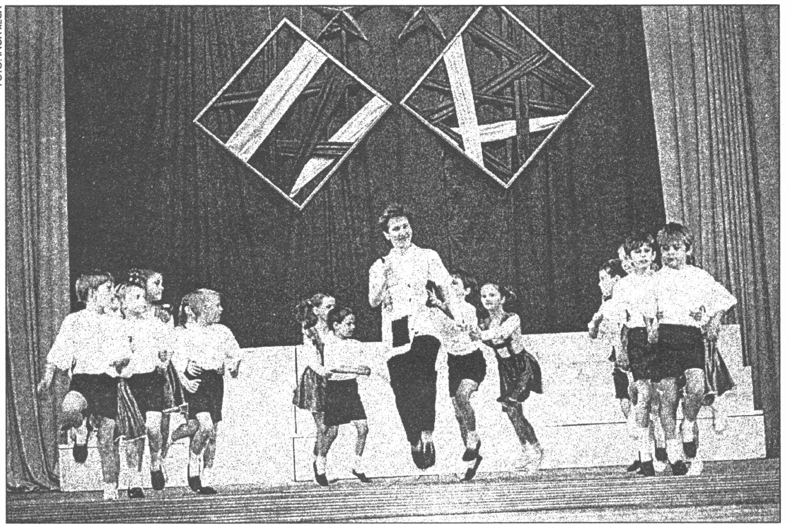
● 4. maijā k/n "Energētiks" notika koncerts veltīts Neatkarības deklarācijas pieņemšanai

Maijs sākās ar diviem latviešu tautai svarīgiem notikumiem, proti - 4. maijā apritēja desmit gadi, kopš pieņemta Deklarācija par Latvijas Republikas neatkarības atjaunošanu, un latviešu hokeja izlase iekļuva pasaules labāko hokeja komandu astotniekā.