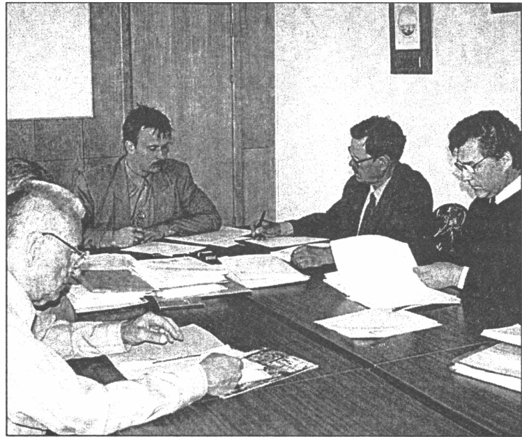
● Domes izsoles komisijai remontdarbu veicējs bija jāizvēlas no 27 pretendentiem