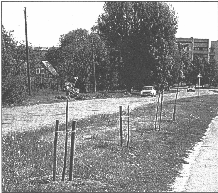
● Nepatīkams pārsteigums: nedēļas laikā tika nolauztas četras no Miera ielā iestādītajām jaunajām liepiņām...

Salaspils pilsētas domes sēdes notiek katru mēneša 3. trešdienā plkst. 16:00, domes ēkā, deputātu istabā.