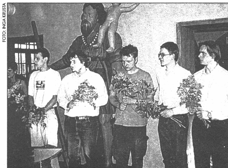
● Daugavas muzejā - studentu darbu izstāde

Izstādē galvenokārt ir apskatāmi mācību darbi - trauki, svečturi, lampas -, kas tapuši pusgada laikā. Ir arī daži lietišķo mākslu vidusskolu beidzēju diplom-