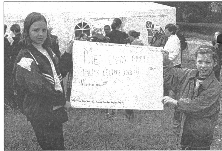
● Protesta akcijā bija iesaistījušies arī bērni