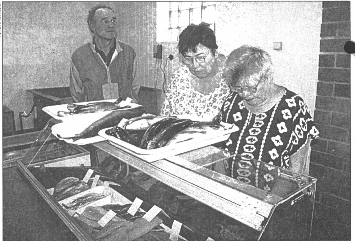
● Pircēji atzina, ka zivju veikalu, kurā var nopirkt svaigas zivis, viņi ir jau sen gaidījuši