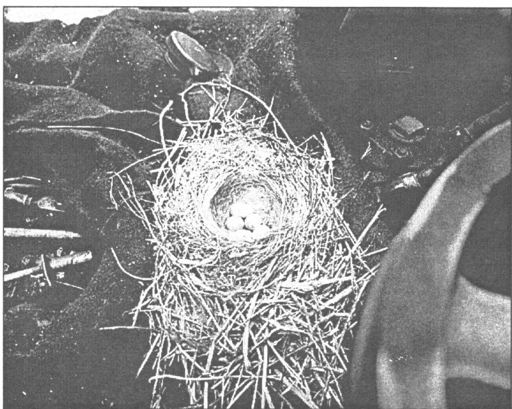
● Cielaviņa izvēlējusies neparastu dzīves vietu

27. jūnijā salaspilietis Arnolds Tučs, sagatavojot savu automašīnu "KAMAZ" kārtējai darba dienai, bija pārsteigts - uz motora savu ligzdiņu iekārtojusi cielaviņa.