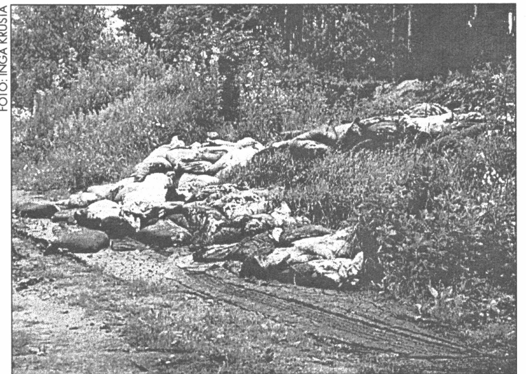
● Maisi ar naftas produktiem atrasti arī Tilderu mežā