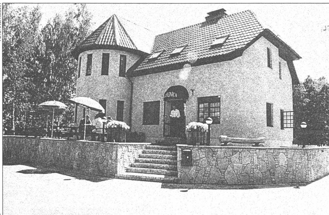
● Pamazām tiek sakopta Zviedru ielas apkārtnē. Kafejnīca "Torņa pils"