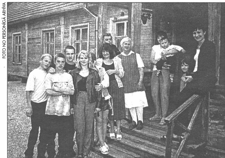
● Nometnieki Talsos - atpūšies, pastrādājuši un laimīgi