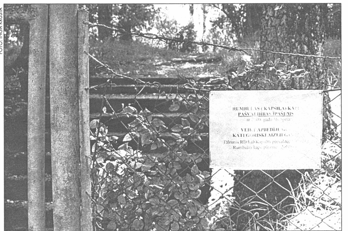
● Norāde par aizliegumu pie Rumbulas kapu ieejas vārtņiem