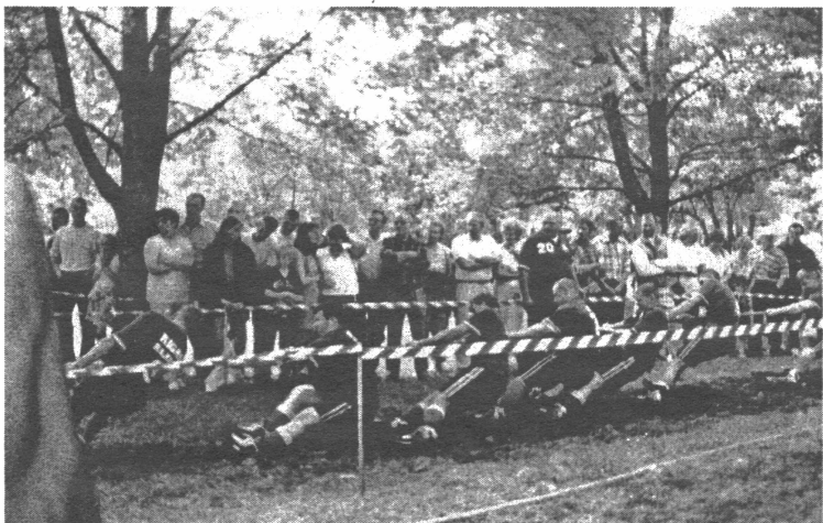
● Virves vilkšanas sacensības piesaista skatītāju uzmanību