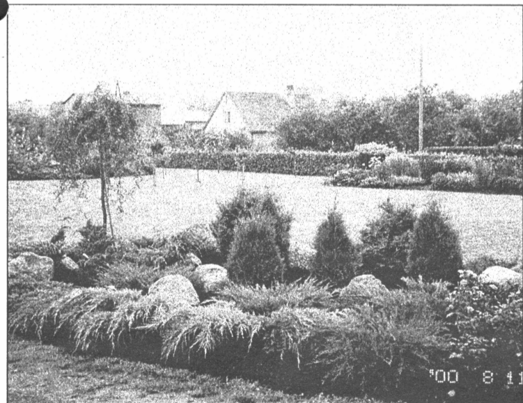
● Redzētie skaistie dārzi Siguldā un Kalngalē mudinās salaspiliešus vēl aktīvāk sakopt savu tuvāko apkārtni