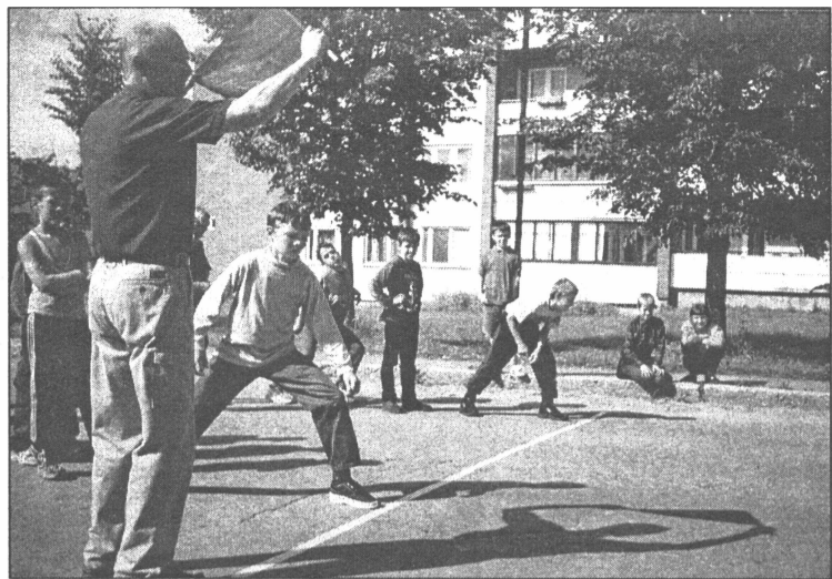
● Tradicionālo bērnu sporta svētku kuplais dalībnieku pulks pierāda, ka bērni grib sportot

2. septembrī Salaspils sporta kompleksā bija pulcējušies Salaspils bērni uz ikgadējiem sporta svētkiem. Šogad mēroties spēkiem bija ieradusies 142 mazie sportotāji vecumā no 3 līdz 14 gadiem. Visvairāk zēnu un meiteņu startēja 11 - 12 gadu vecuma grupā - 39!