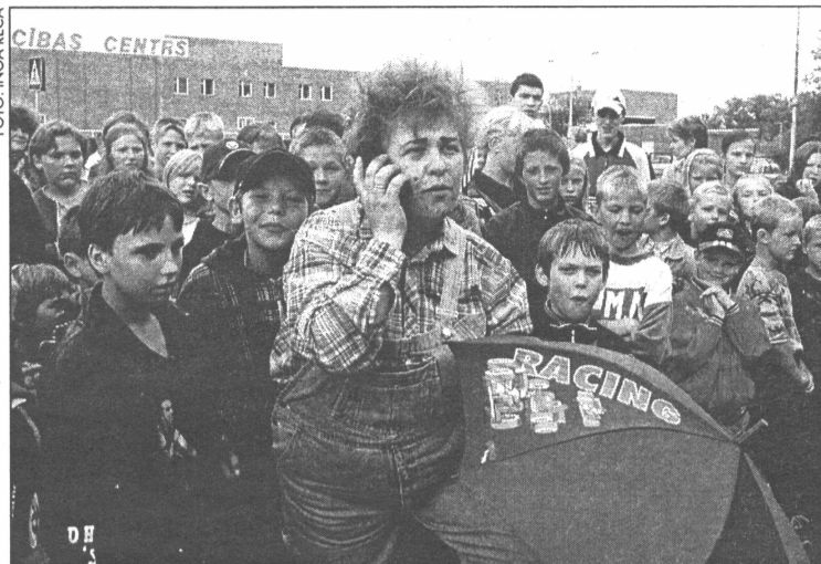
● Tiem loterijas vinnētājiem, kuri nebija klāt, Karlsons šo prieku vēsti paziņoja ar mobilā tālruna palīdzību

Jau otro gadu grāmatnīca Herco pirms jaunā mācību gada sākuma rīko akciju Karlsons lido uz skolu . Akcijas laikā visi čeki piecu latu vērtībā piedalās loterijā, kurā tiek izlozētas dažādas skolasbērniem noderīgas mantas. Šogad uz izlozi atkal bija atlidojis Karlsons pats un vēl "paķēris" līdzīgu popgrupu Atvasīte . Firmas Rilita dāvētās trīs fotofilmiņas laimēja