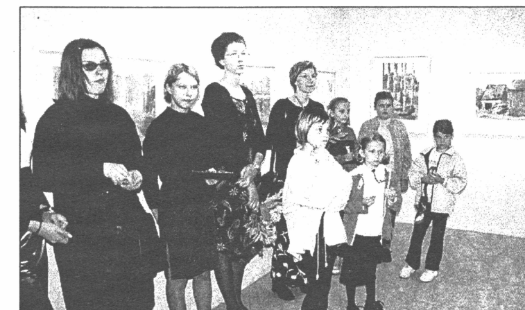
● Gan skolotājas, gan mazie mākslinieki vasaras praksi atceras ar prieku