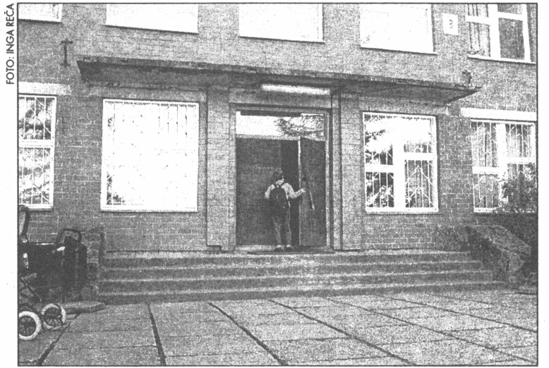
● SALASPILS POLIKLĪNIKA: oktobrī remonts turpināsies gan poliklīnikas vestibīlā, gan tiks nomainītas ārdurvis