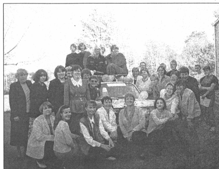
● Salaspils 1. vidusskolas skolotājas pēc leģendārā brauciena ap skolas akmeni

SJ Labklājības ministrijas Sabiedrisko attiecību nodaļa