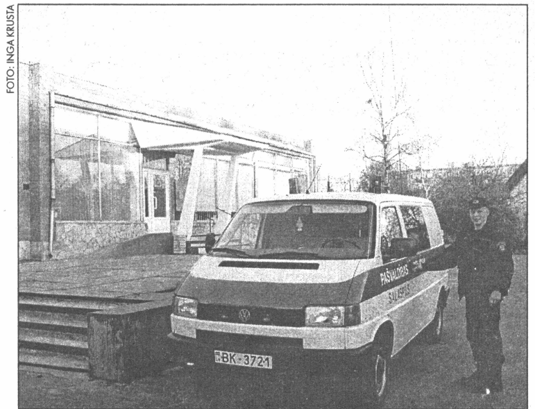
● Jaunā pašvaldība policijas apmešanās vieta - līdzās aptiekai Lauku ielā