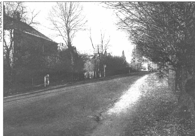
● Rīgas ielas posms no dzelzceļa pārbrauktuves līdz Silavai diennaktis tumšajā laikā ir bīstams gājējiem