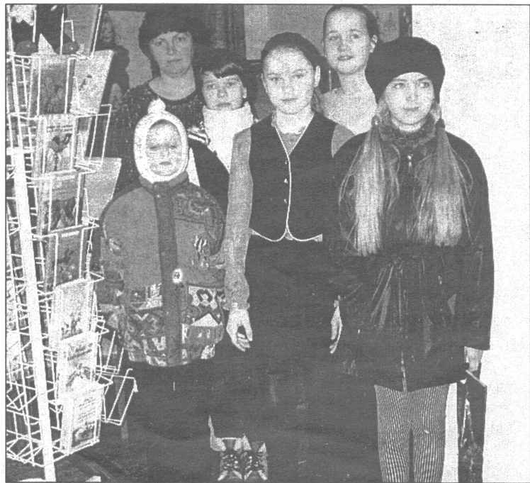
● Lasītāji apskata Zviedru bērnu grāmatu izstādi Satiec bērnus!