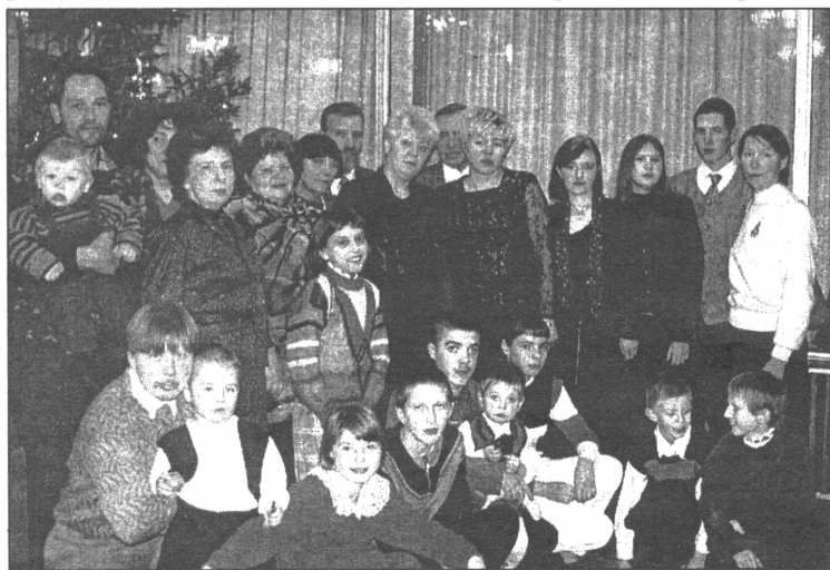
● Skolas ielas 7. nama iedzīvotāju "ģimenes bilde"