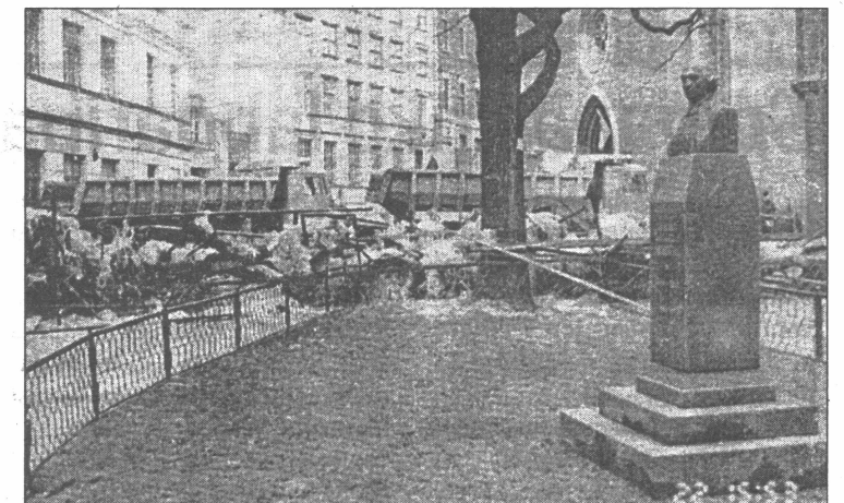
Vecrīgā 1991. gada janvārī