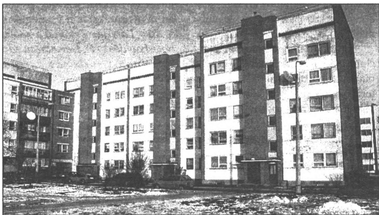
● Šajā mājā Dienvidu ielā 7/2 drīz remontēs kāpņu telpas un būs durvis ar koda atslēgu

SV Dzīvokļu daļas vadītāja Sarmīte MACEŠOVA