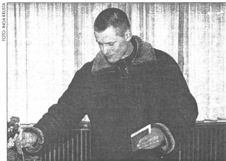
Salaspilī pašvaldību vēlēšanās kopumā piedalījušies 9270 jeb 62,8% balsstiesīgo

Jaunā 2001. - 2005. gada sasaukuma Salaspils domes deputāti (alfabēta secībā)