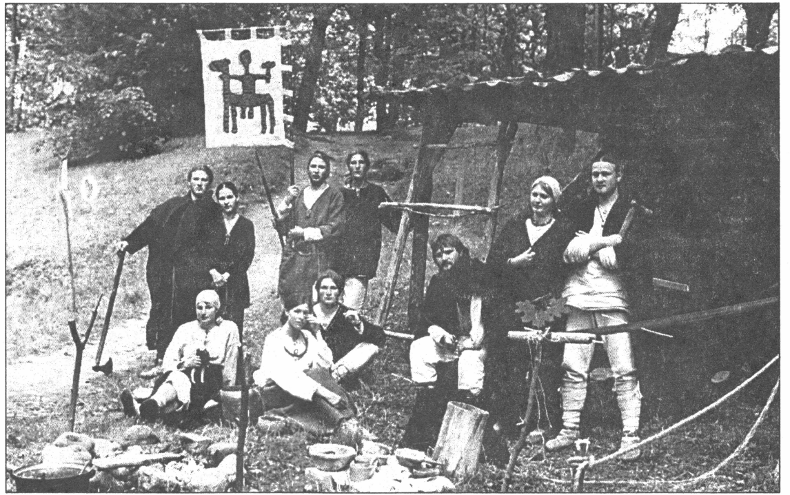
● Muzeja dienā Senās vides darbnīca rādīs, kā dzīvoja un strādāja mūsu senči pirms tūkstoš gadiem

Protams, rodas jautājums, kādēļ mūsdienu racionālajam cilvēkam, kurš lieto mobilo telefonu,