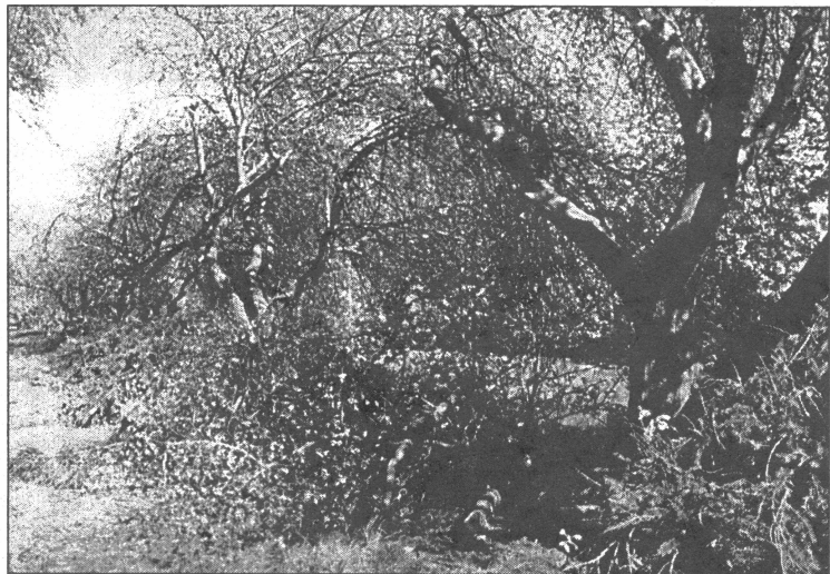
● Nav brīnums, ka pašā ziedonā apzāģētās ābeles izraisījušas Saulkalnes iedzīvotāju neizpratni