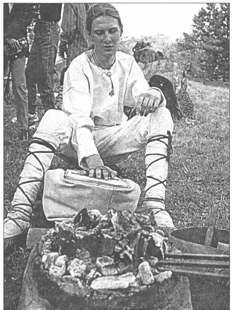
● Kalēja mācekļi darbina plēšas "Senās vides darbnīcas" rīkotajā pasākumā Starptautiskās muzeja dienas ietvaros

Tūres uzvarētāji saņem godarakstus, bet kopvērtējumā katrā grupā trīs labākās komandas - diplomus, medaļas, balvas.