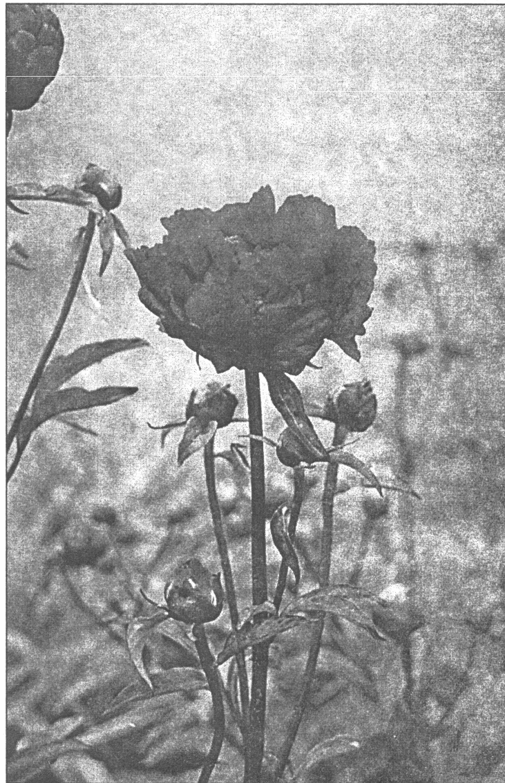
● Griezta pujene vīrieša rokās smaržo mazāk...