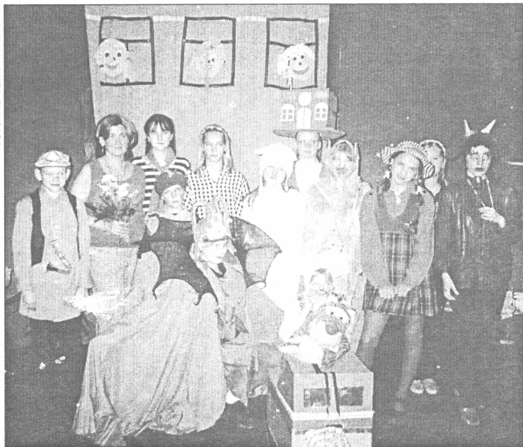
● Salaspils dramatisks kolektīvs Valmieras teātra festivālā