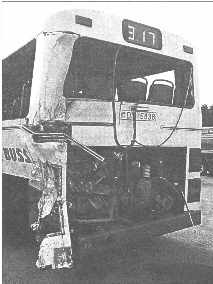
● Maršruta autobuss pēc sadursmes ar smago automašīnu