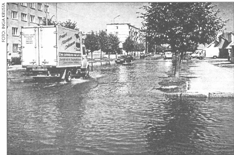
● Maģistrālā ūdensvada avārija jau otro reizi šovasar izraisa plūdus Skolas ielā