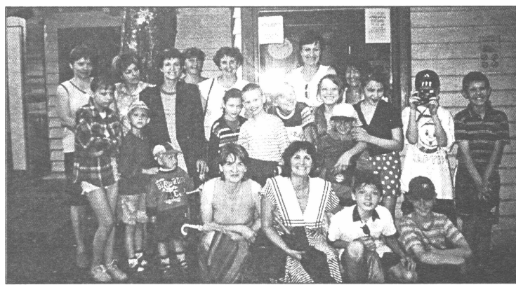
● Kopā pavadītais laiks nometniekiem radījis daudz prieka