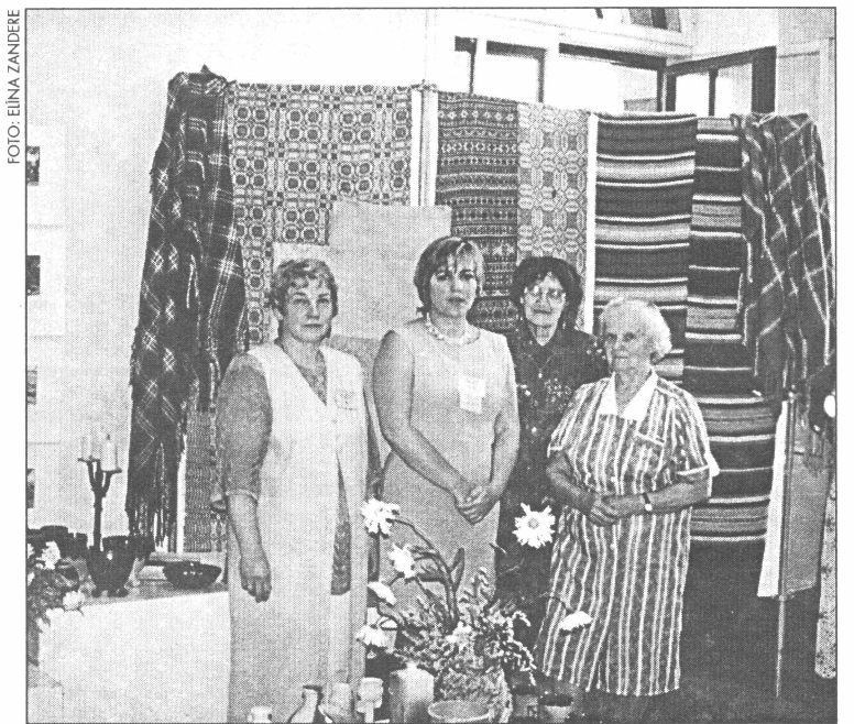
● "Spīganas" pie savu radošo darbu stenda konferencē-izstādē "Sievietes Latvijā laiku gaitā"