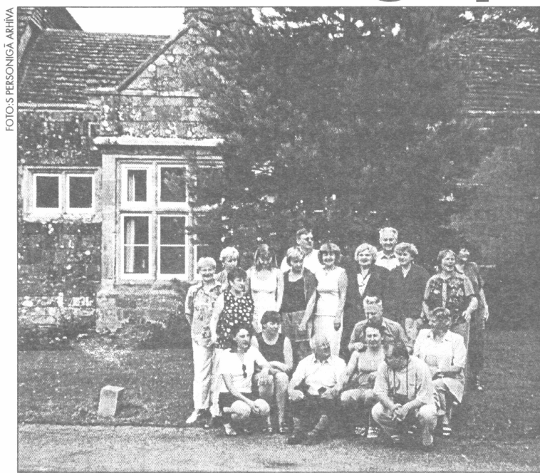
● Latvijas delegācija pie veco ļaužu aprūpes centra "Rowfanta" Anglijā