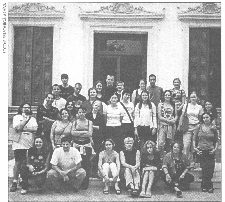
● Salaspils un Seviljas jauniešu komunikācija turpināsies

Ja gribat iemācīties dažādus viltīgus sikumus, kā padarīt apnikušu apģērbu par atkal tikamu, - nāciet uz nodarbībām ceturtdienās plkst. 17:05. Tālr. 44397