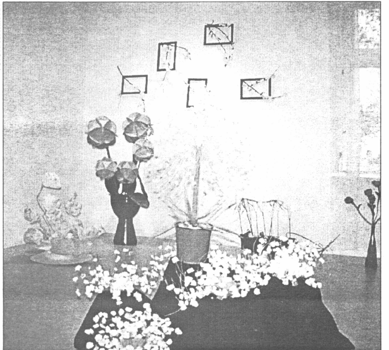
● Pārliecināties par Salaspils pirmsskolas izglītības iestādes darbinieku māksliniecisko, praktisko un labestīgo dzīves uztveri iespējams ne tikai uzticot viņiem savu bērnu audzināšanā, bet arī apmeklējot Salaspils Izstāžu zāli. Tur līdz 8. decembrim apskatāma bērnu audzinātāju un tehniko darbinieku kompozīciju izstāde Ziedi manai pilsētai , kas tapusi, piepalīdzot pašiem audzināmajiem mazuļiem. Tas viss - vēl joprojām par godu pilsētas jubilejai.