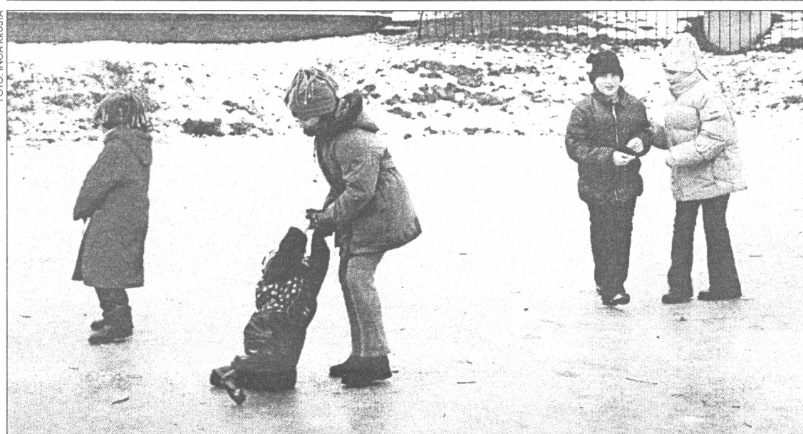
● Salaspils bērni, klusībā ilgojoties pēc slidotavas, ierīkojuši ziemas prieku laukumiņu aizsalušajā diķī pie pilsētas domes. Viņi SV apgalvoja, ka slidotavā pavada katru dienu un ledus biezums no šim izpriecām viņus neatturēs