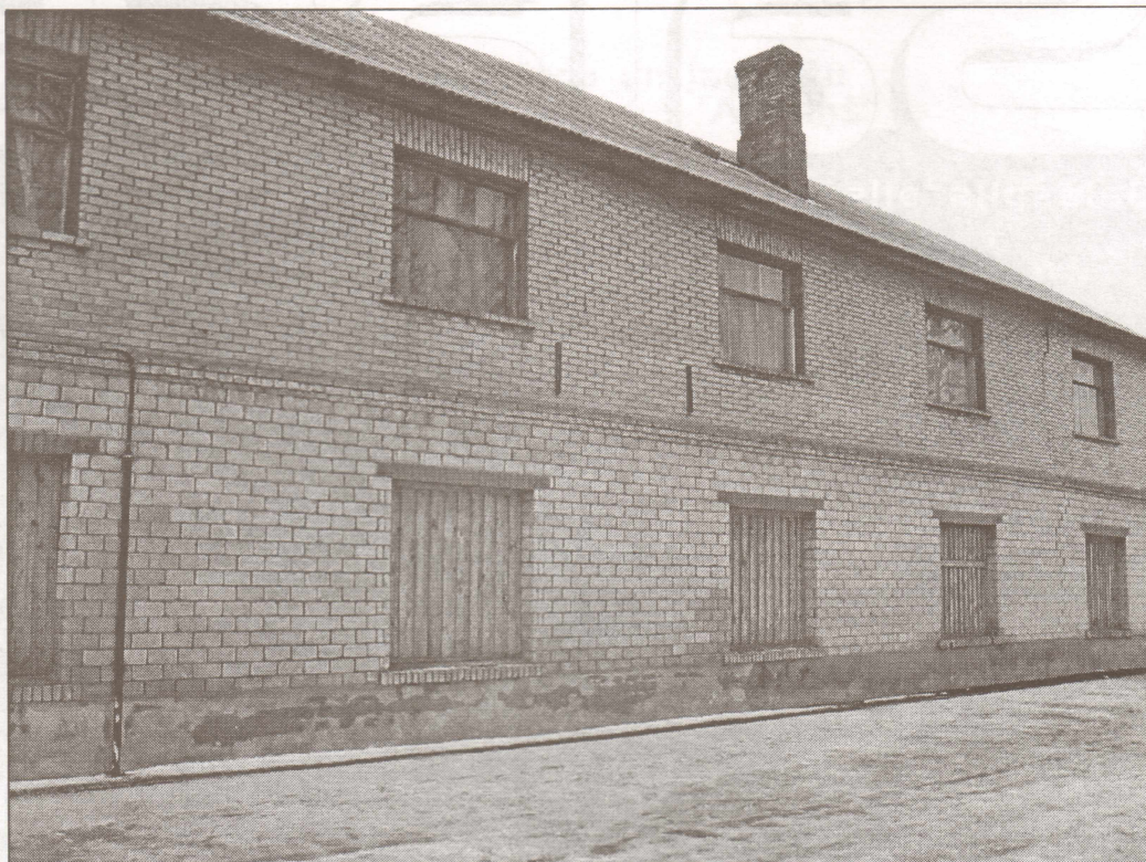
Viens no strīdus objektiem- ēka Salaspilī, Līvzemes ielā 5.

Kasācijas sūdzību izskatīja senāts paplašinātā, 7 senatoru sastāvā, kas civilstrīdos ir diezgan rets notikums.