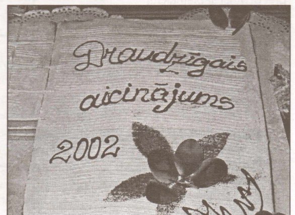
Saldākais dāvinājums tika akcijas noslēguma dalībniekiem