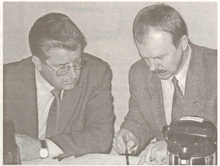
LR Satiksmes ministrs A. Gorbunovs piekrīt Rīgas ielas atjaunošanai.

Tas, kurš modelis īstenosies, būs zināms maijā. Viss atkarīgs no Valsts autoceļu fondā ieskaitītā akcīzes nodokļa marķa un aprīli. Ceļu labošana un atjaunošana prasa ļoti daudz līdzekļu. Piemēram, Rīgas ielas atjaunošanas kopējās izmaksas ir aptuveni 200 000 Ls. Savukārt bedrīšu lāpīšana izmaksā 7 Ls m 2 . Ministrs uzsvēra, ka problēma jāturpina risināt valdības līmenī. “Es neredzu citu alternatīvu kā valsts autoceļu fondā ieskaitīt 85% no akcīzes nodokļa naftas produktiem līdzšinējo 60 % vietā”, tā ir vienīgā iespēja plānveidīgi rekonstruēt un atjaunot autoceļus, ne tikai lāpīt bedrītes.