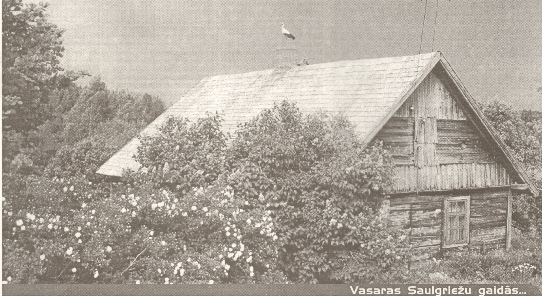
Vasaras Saulgriežu gaidās...

Visas bija Jāņu zāles, Ko plūc Jāņu vakarā. Visi bija Jāņu bērni, Kas Jānīti daudzinaja.