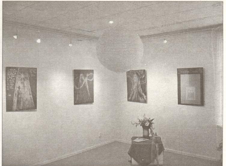
Gaismas spēles Izstāžu zālē.

Šim mākslas darbam telpisku risinājumu - instalāciju raduši mākslinieki Igo Celmiņš un