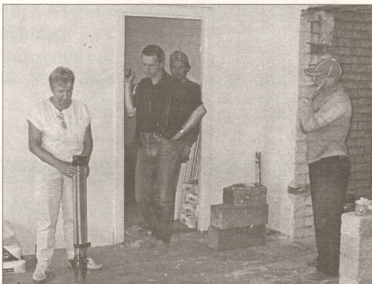
Remontdarbi rit pilnā sparā...

Sabiedriskais centrs būs atvērts un pieejams ikvienam interesentam. To varēs apmeklēt ne tikai sabiedriskās organizācijas, bet arī jaunieši, pensionāri un invalīdi.