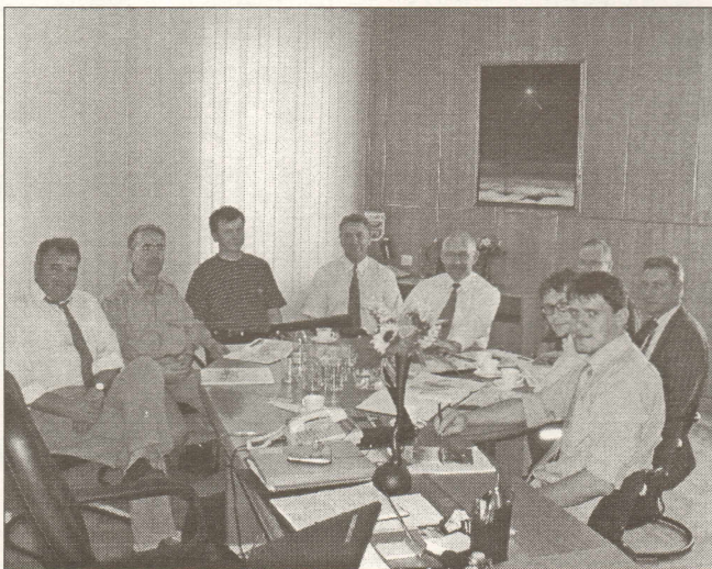
Projekta atbalstītāji tikšanās brīdī Salaspils domē.