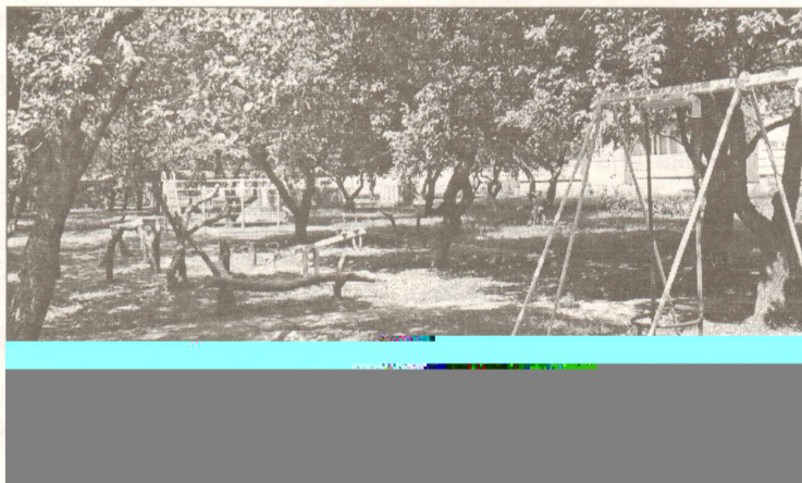
Bērnu rotaļu laukums pie veikala "Ābelīte".

Salaspils pilsētas ar lauku teritoriju domes vadība ir padomājusī, lai bērniem būtu aktīvas atpūtas iespējas. 2002.gadā tika piešķirti Ls 5000,- jau esošo bērnu rotaļu laukumu atjaunošanai un jaunu būvēšanai. Projekta rea-