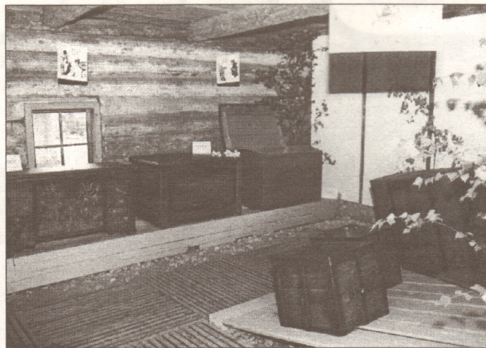
Izstādē apskatāmās lādes