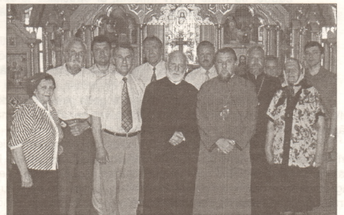
Viesošanās laikā Salaspils pareizticīgo baznīcā